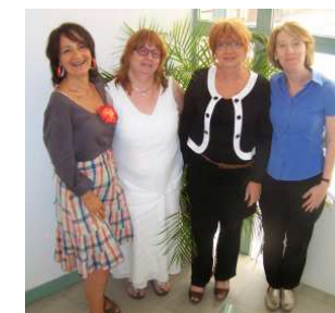
L'équipe CRC de Melun

- une adresse mail unique : infocci@seineetmarne.cci.fr