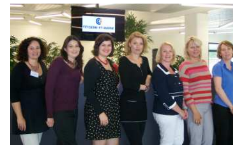
L'équipe CRC de Serris