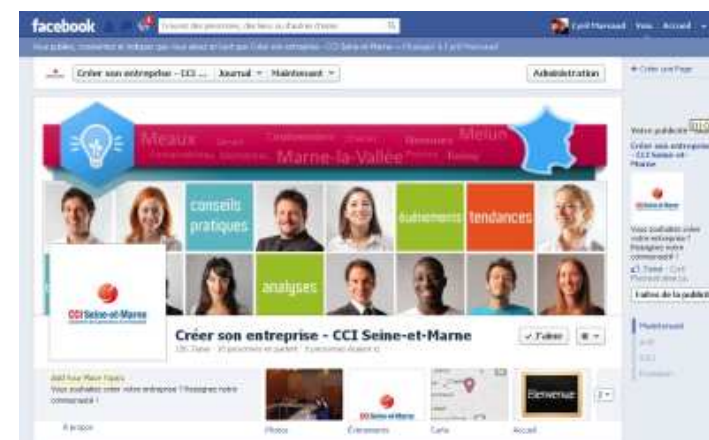
Vue de la page sur Facebook

« Créer son entreprise - CCI Seine-et-Marne »